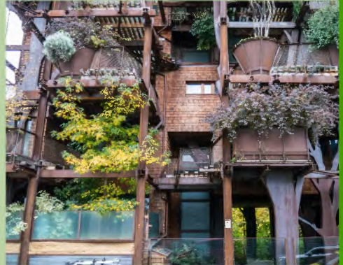
Casa Verde Luciano Pia

Um diese Spannung aufzulösen braucht es innovative Konzepte. Ein Lösungsansatz hier ist der Bau in die Vertikale bei gleichzeitiger Grüngestaltung von Innenhöfen und Dächern. Umgesetzt in einem Dorf wie Uttenreuth kann dies bedeuten, dass keine neuen Reihen- oder Doppelhaus-siedlungen mehr entstehen, sondern stattdessen bis zu vierstöckige Gebäudekomplexe, die Wohnungen verschiedener Größen anbieten.